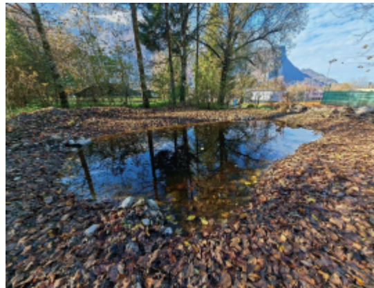
Biotop Wydeli in der Nähe des Tennisplatzes

Dieses Gewässer, vor bald zehn Jahren als Ersatzbiotop für ein Bauvorhaben der Gemeinde Glarus Nord erstellt, war im Laufe der Jahre undicht geworden.