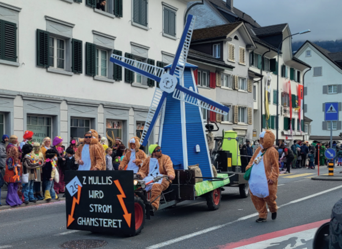
Die Flugplatzmuuser am Fasnachtsumzug in Näfels 2023